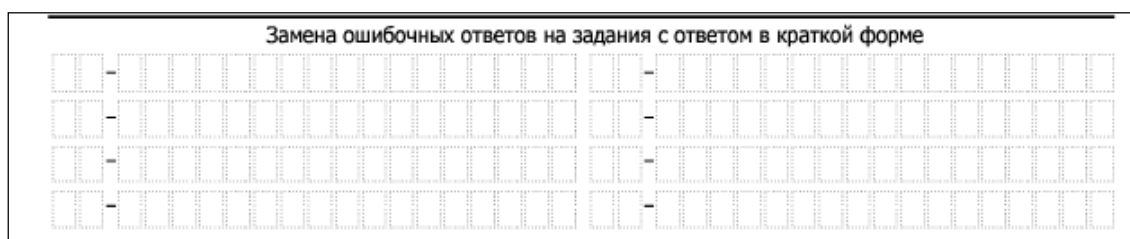
Рис.3. Область замены ошибочных ответов на задания с кратким ответом

В случае, если КИМ не предусматривает записи ответа на бланке №1, поле для записи ответа заполнено символами «XXX».